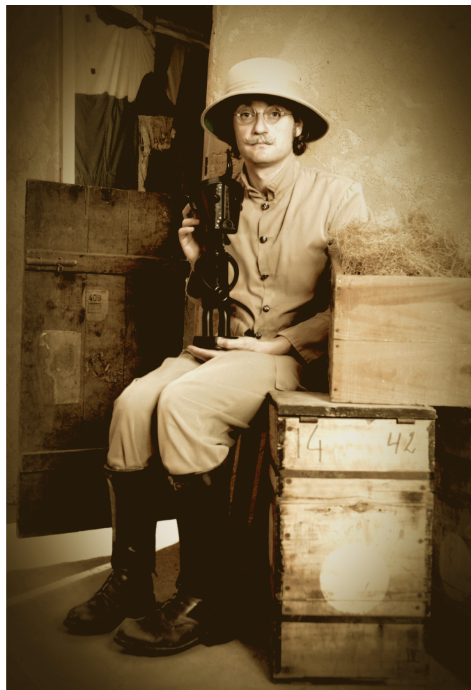
Portret van Léopold Vonpischmeyer © Collection Vonpischmeyer, Olivier Goka, 2007

sculpturen die rechtstreeks geïnspireerd zijn op de catalogi en kunstwerken bewaard in de musea voor Afrikaanse etnische kunst. Een ludieke en ongewone benadering waarbij wordt gespeeld met echt en nep, oud en nieuw, het sacrale en het elektrisch afval van onze consumptiemaatschappij. Thema’s die via de collectie gaan resoneren met de vele museum-gerelateerde problemen. De vervaardiging van de kunstwerken van de collectie Vonpischmeyer – met de naam van een imaginaire verzamelaar, dubbelganger van de kunstenaar, verwoed verzamelaar van materialen – bestaat exclusief uit een assemblagemethode van plastic die Olivier Goka reeds vele jaren nauwgezet ontwikkelt. In zijn atelier heeft de kunstenaar een onwaarschijnlijke hoeveelheid plastic onderdelen verzameld en geklasseerd volgens kleur en vorm, die hij her en der wist bijeen te sprokkelen mede met de hulp van zijn entourage. Zijn kunst bestaat uit zijn vermogen van het visualiseren van het vooropgestelde kunstwerk dat tot stand zal komen met deze veelvormige bestanddelen.” François Delvoye 4 4 http://oliviergoka.com/vonpischmeyer