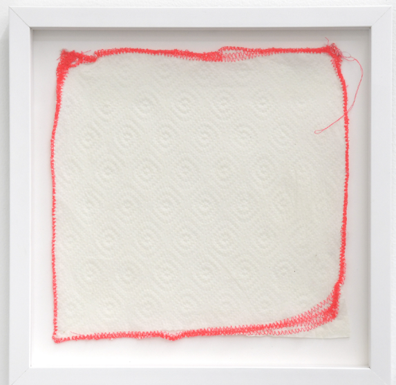
Papier brodé 2, 2019. Tatiana Wolska, 29 x 29 (framed), Sewing on tissue paper

https://beq.ebooksgratuits.com/vents/Gogol-manteau.pdf