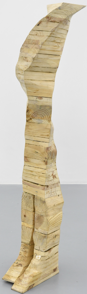
One pallet sculpture - Gênée, 2022. Tatiana Wolska, 148 x 36 x 38 cm, Wood pallet and screws.

Tatiana Wolska maakte ook een reeks sculpturen met houten paletten die zij op straat vond en die zij willekeurig verzaagde. De kunstenaar herschikt de elementen tot een sculptuur zonder pretentie. Het werk krijgt zijn titel door zijn uiteindelijke vorm. Tatiana Wolska werkt momenteel aan een twintigtal houten sculpturen voor een tentoonstelling in Birmingham, en ook aan een 'sociale sculptuur' in de vorm van een grote houten hut waar contacten zullen plaatsvinden met lokale sociale organisaties rond de parallelle economie (tweedehands kleding, reparatie van objecten ...)